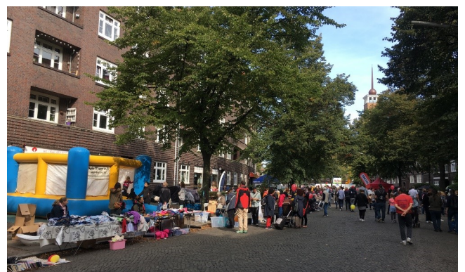
Dithmarscher Straßenfest, u.a. finanziert aus Verfügungsfondsmitteln