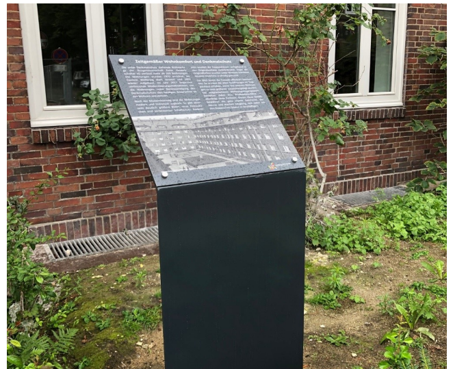
Entdecken Sie die historischen Infostelen auf dem Dulsberg auf eigene Faust mit dem Flyer „Rundgang auf dem Dulsberg“, erhältlich unter www.dulsberg-denkmalschutz.de sowie im Stadtteilbüro

Das kurze Antragsformular gibt es zum Download auf www.dulsberg-denkmalschutz.de .