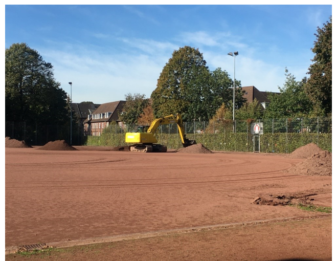
Der Sportplatz Vogesenstraße erhält ein neues Gesicht: vom Tennen- zum Kunstrasenplatz

Zusätzlich findet eine grünplanerische Begleitung statt. Neben dem bereits vorhandenen, mittigen Zugang ist ein weiterer Anschluss im Nord-Osten zum Grünzug vorgesehen. Hierdurch wird eine optimale Zugänglichkeit und Anbindung des Sportplatzes an den Grünzug gewährleistet.