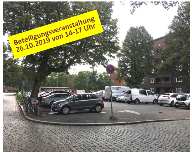
Ihre Ideen sind gefragt!

Alle Interessierten, ob Jung oder Alt, sind herzlich eingeladen, den Platz von Morgen mitzugestalten und Ideen einzubringen.