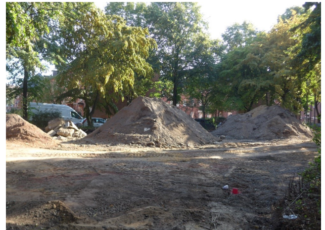
Gleich zwei Spielplätze im Fördergebiet Dulsberg werden umgestaltet

Die Fertigstellung des Spielplatzes Tiroler Straße ist für November 2019 geplant. Die Baumaßnahme Spielplatz Rollerbahn endet voraussichtlich im Frühjahr 2020. Mit einer Einweihungsfeier soll der Spielplatz Rollerbahn im kommenden Jahr feierlich neu eröffnet werden.