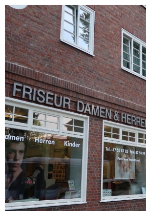
Denkmalgerechte Werbeanlagengestaltung: So kann es aussehen.